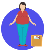
ИЗБИТОЧНАЯ МАССА ТЕЛА, ОЖИРЕНИЕ