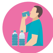
ЖАЖДА И СУХОСТЬ ВО РТУ