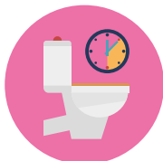
ЧАСТОЕ И ОБИЛЬНОЕ МОЧЕИСПУСКАНИЕ