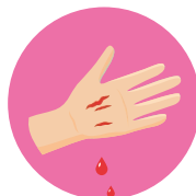
ДЛИТЕЛЬНОЕ ЗАЖИВЛЕНИЕ РАН, ГНОЙНИЧКОВОЕ ПОРАЖЕНИЕ КОЖИ, ГРИБОК НОГТЕЙ