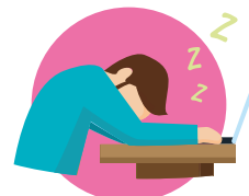
БЫСТРАЯ УТОМЛЯЕМОСТЬ, СЛАБОСТЬ