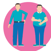
ИЗМЕНЕНИЕ МАССЫ ТЕЛА (увеличение или потеря веса)