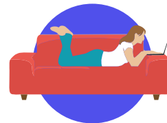
НИЗКАЯ ФИЗИЧЕСКАЯ АКТИВНОСТЬ

Риск развития сахарного диабета значительно увеличивается при сочетании факторов риска: повышенный уровень артериального давления, холестерина в крови, ожирение