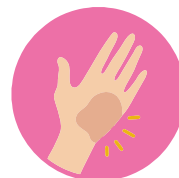
ЗУД КОЖИ И СЛИЗИСТЫХ